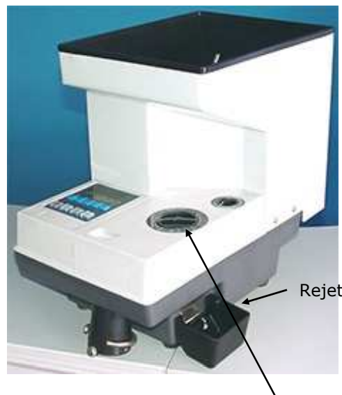
Sélection de la valeur à compter