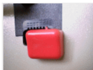
Présélection de la quantité mise en sac